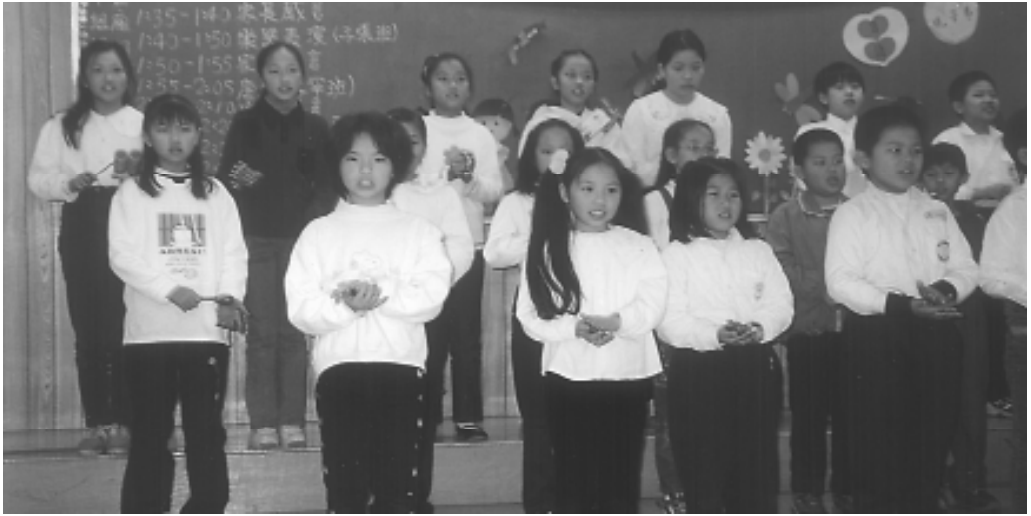
借由讀經教育激發兒童潛能。

德仍淨；記憶猶強、悟性微弱，童蒙培養正見，正宜此時。正是推行兒童讀經的時期，可以激發兒童的潛能。