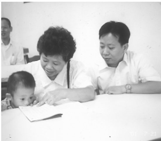
兒童讀經可達幼兒養性之效。