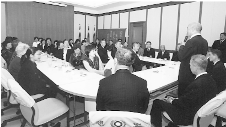
簡前人慈悲賜導，並祝福大家萬事如意，道務宏展。

簡點傳師並以詩偈：『大道傳天下，千愁一指開，歡顏無爾我，個個面如來』鼓勵大家要笑口常開，並有一番妙喻：「修道就是『超塵脫俗』，超塵脫俗才能夠『移風