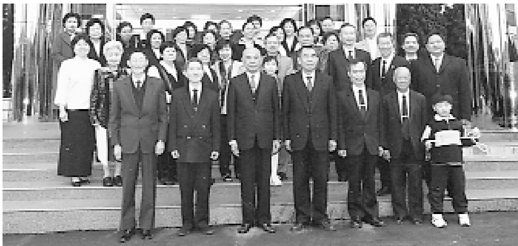
簡前人、點傳師及加拿大道親們，於忠恕道院前合影。

會有那麼多混亂、紛爭？就是人心變壞、無法柔軟、為自己的私利、名利而硬碰硬、強比強，將原本的人間天堂變成貪婪之島，人也變成凶獸猛鬥，所以變成三期末劫，種族之間、國與國之間都是因為這樣的因緣，沒有緩衝餘地，沒有緩和空間。