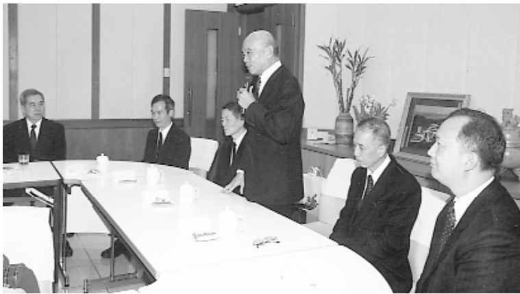
簡前人、各位點傳師歡迎加拿大道親們回來 老家的家。

合，以此為目標共同努力，回來台灣總壇要將所學、所見、所聞，傳真到加拿大給更多當地道親了解。