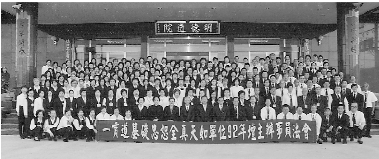
普化「明德」照十方，覺照本心明白性。

今幸逢大道普傳，求得原一大道，當珍惜這千載難逢的殊勝因緣。法會第一天即進行分組討論，討論的三大主軸： 1. 三寶心法 2. 十條大愿 3. 愿懺文。討論時，大家不是很踴躍，可見我們平常很少深入探討，也難得有時間去思維，相信這是很多人的通病。三寶是我們自家本有的寶藏，雖有而不顯，有而不得利用，等於無。自從求道那一天，點傳師確實傾囊相授，可惜我們不識珍寶視同俗物。