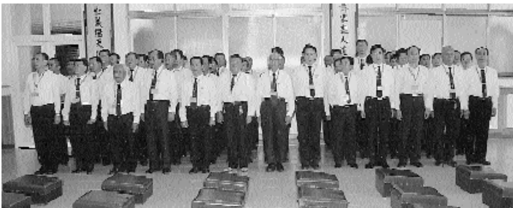
法會殊勝、因緣難逢。

師尊云：查愿懺文，乃修道人日常功課，極為重要。所以上至前人，下至一般道親，天天都得默唸愿懺文。然而我們每日在燒香禮中默唸愿懺文，囫圇吞棗，把愿文當作唸經般的忽略過去，從不體會愿懺文真正的含意。對愿懺文一知半解。因此呼籲大家，默唸愿懺文，必全神貫注，萬緣放