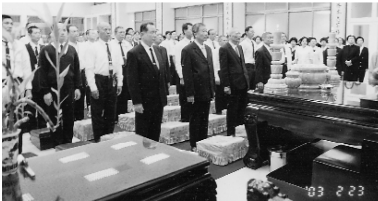
法會前莊嚴之燒香禮。

在傳燈單元中每位學員從一樓祖師殿點燈後小心翼翼護送到三樓老中堂，不過在過程中有很多支扇吹著，一不小心就被吹熄，必須回到一樓重點，學長們一次又一次的重新點燃，讓大家體會到要保護這有形的燈都這麼困難，要如何護著無形那盞心燈呢？到最後大家用雙手、衣袖、杯子、紙張等遮風才能順利過關。這也啟