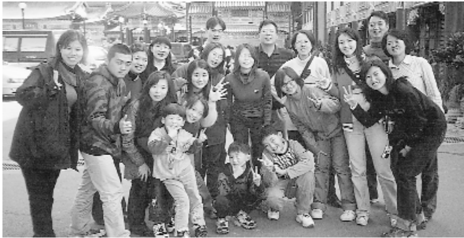
於觀光景點留下珍貴的鏡頭。

聲音，當然囉！這麼美味的東西怎只甘於試吃呢？參觀完「蜂採館」，人手一包，滿載而歸。