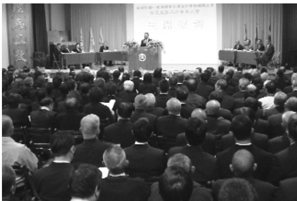
會員們踴躍參與盛會。