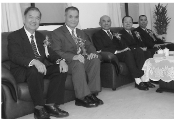
前人及點傳師們攝於貴賓室。