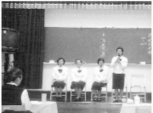
「道親成全錄」單元，激發壇主們瞭解使命之神聖。

最後一個單元為「回到原點」，安排以分組的方式討論「身為壇主如何進修與精進、持續初發