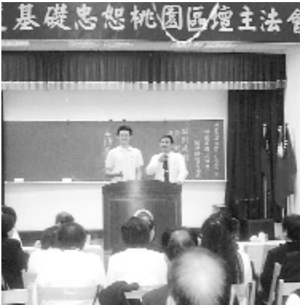
「回到原點」單元，激發壇主愿力之再啟發與再提昇。