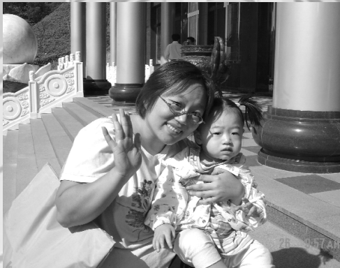
陳小姐與姪女攝於祖師殿前。

至六樓會場。整個隆重的古禮儀式由前人輩們的致詞開始，眾人跟著沐浴在佛光慈語之中，伴隨著合唱團詩歌朗誦及誦經團的誦經聲中，在當下與先人之間，似乎有種毫無時空距離的心靈接觸，溫暖之情在中心動盪著。 在滿座的人群中，記者看見一行人身穿白色休閒服，上面印著「寶光紹興」字樣，他們素雅整潔的服裝吸引記者前往向他們打招呼！才知他們是來自基隆的寶光紹興道親，一大早就搭車和同修們結伴而來，因有祖先供奉於先天寶塔。而他們其中也有人早已預訂了塔位，大部份都是第一次參與祭典，感覺到非常莊嚴隆重，且這裡的環境是那麽安詳平靜，一點也不會感覺出陰森森的氣氛。建築物及一切設備是那麽現代化，很適合廿一世