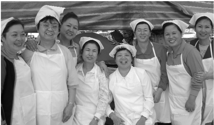
九樓攤位廚師媽媽們，各個法喜充滿。

來到寶塔現場，眼前香煙裊裊，人潮擁擠，大家皆手拿一柱馨香，以最虔誠的心來感念自己的先人，有的更是跪在佛前，以五體投地之禮來敬拜祖先。而在天公爐一隅，記者看見一位臉龐紅通似蘋果般的小朋友，他戴著手套，站立在一旁等待著，記者向前探問，原來他的工作是將香爐中已經插滿的香拔起來投入一旁的筒子。問他喜不喜歡做這份工作？他說：喜歡！且很好玩！而他從六點多就站在這個崗位