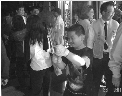
小朋友服務熱忱，不落人後。