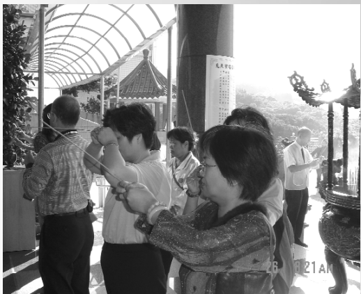
晉塔先賢家屬虔誠祭拜一隅。