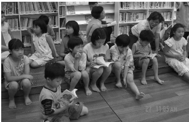
親子共同閱讀的最佳環境。

天熙親子圖書館因為有道務中心的全力支持，再考量地區性的條件，而將使用對象放大，除道親外，更擴及社區人士及兒童，使目前連書店都還沒有好的山佳地區，擁有一個可以看書的去處！而且，是一個適合全家大小一起來閱讀的地方，因此名為「親子圖書