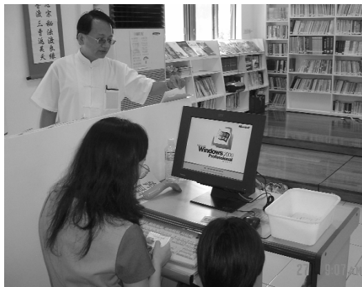
電腦化的借書管理制度。