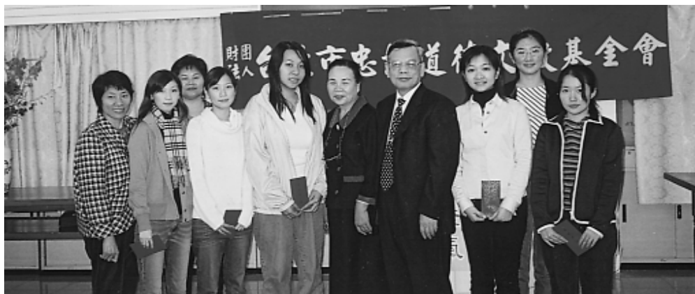
兩位點傳師(右四、五)與受獎同學、家屬代表們合影。

優良，本基金會尤其注重道德、品行；所以我們學業或許平平，但是道德一定要好，基金會每年都會舉辦此活動，以鼓勵同學向學、培養良好的品德，往後各位不妨介紹我們成績優秀的同學一齊來申請獎學金。」