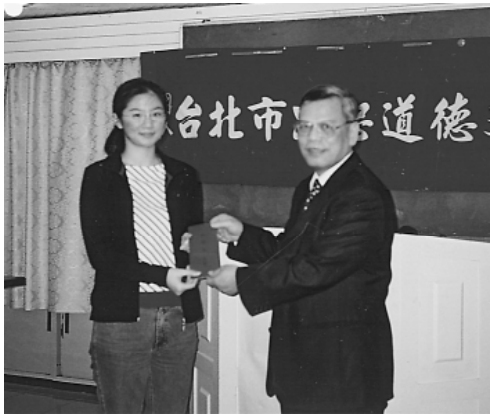
葉點傳師頒發獎學金予受獎同學。