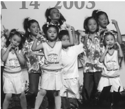
可愛的兒童表演，看到道場未來的希望。