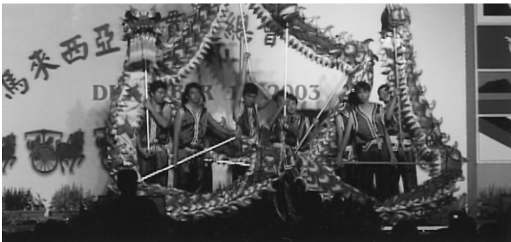
祥龍點頭，火中生蓮，萬世太平。

體、社會人士等前來祝賀，我們來自世界各國的道親都欣喜萬分趕來護持。我們相信是由於前人輩睿智的指引，前賢大德的犧牲奉獻精神及無為的付出，受到異邦國家元首的肯定、人民的愛戴，給我們正面的回應，才能有如此大的盛會來運作。