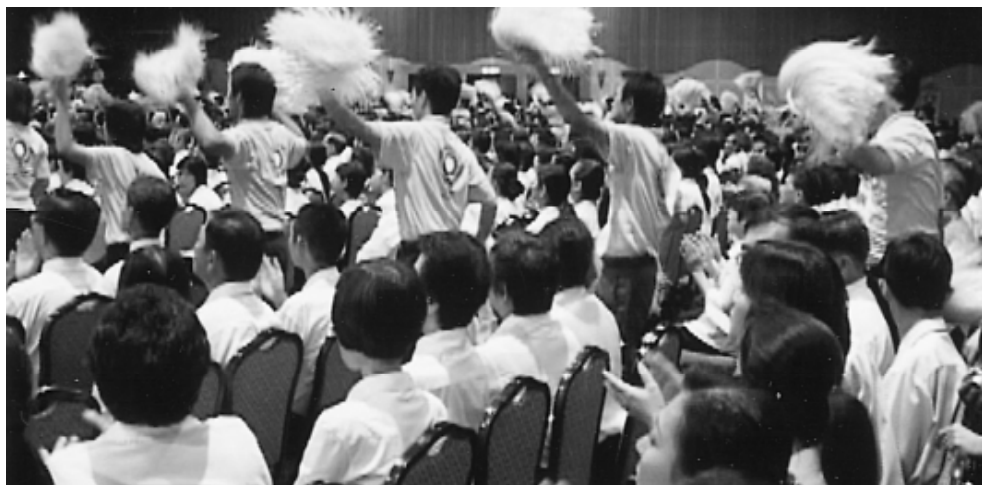
四百五十位學界青年帶動唱營造澎湃氣氛。

句的，後學一看，原來是那位老菩薩，看到她很內疚的口吻說：「很抱歉，我這樣害大家為我擔心，失禮啦！失禮啦！」接著她笑呵呵的邊跳邊說：「感謝上天慈悲，我沒受傷啦！」在那當下，何謂彌勒家風？當下即是。