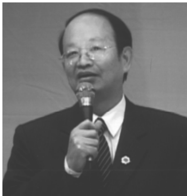
考試院朱秘書長讚揚一貫道。

袁前人特別蒞臨開示：由於當今社會混亂，雖然科技文明，然而國際局勢危機重重，人類可能遭受浩劫，上天不忍，老母慈悲，許多仙佛倒裝下凡，搭幫助道，奉天命護持道場。一貫道弟子應當依理修持，認理歸真，修道當找回自性，改毛病、去脾氣，孝道為先，人道圓滿，天道自成。謹記：一、多讚美，常說好話，道場一團和氣，社會進步，國