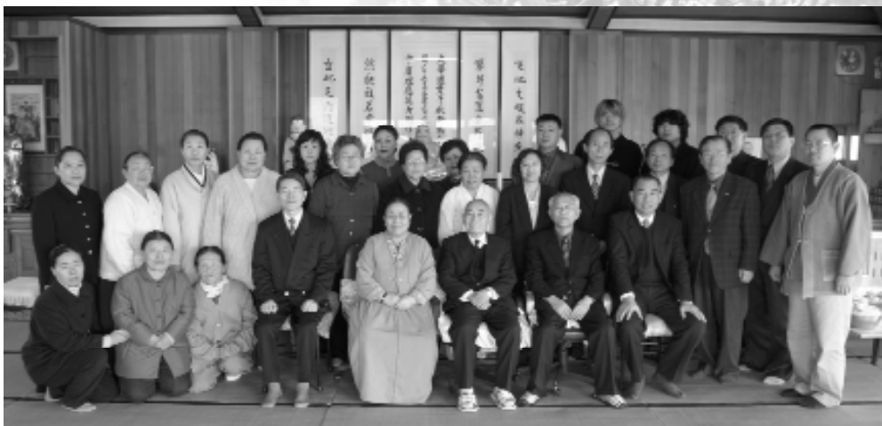
我們永遠團聚於 中懷中！