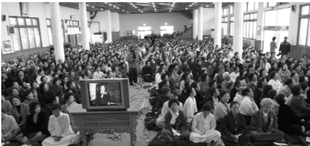
重沐金老前人大德慈悲。

功，這就是所說：『有苦學必須苦幹，要苦幹必須苦學』這個題目，與過去聖賢王陽明所說的知行合一是一貫的，真偉大啊！如果只求苦學而不去苦幹，有何用呢？請看我們中國，過去弊病，皆以苦讀為利己主義，爭取幾級科第，不肯為國家效勞，盡忠報國，這個是有知無行之弊，讀書人，只怕誦的明人語，去做自己事，像這等人，就是在校十年，破卷五車，成甚用呢？這等思想，就成了亡國之蠹，空貽笑柄。