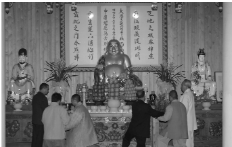
教育院繩墨法壇獻供禮。

德光，永遠不息地普照著大地，讓紛紛擾擾群生有著光明指引！很快，車子離開機場，在駛來四平八穩，技術超群的