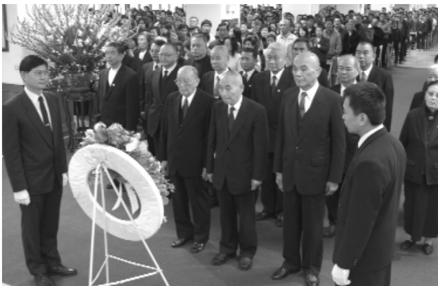
袁前人代表老前人主祭。