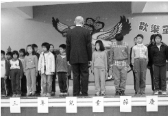
簡前人代表基礎忠恕道場頒發獎助學金。