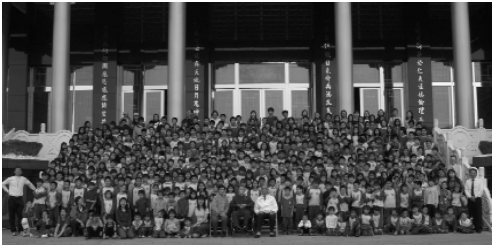
德澤學子，努力向學。