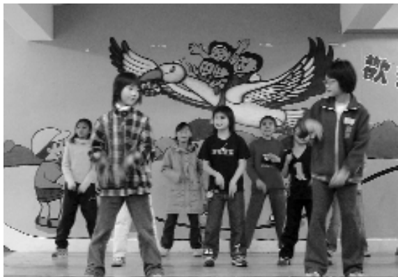
舞動青春，熱力活現！

前人，我這次拿到獎學金很高興，謝謝您對福源的祝福，雖然不能當面說這些話，但我還是會記得忠恕道院為我們所做