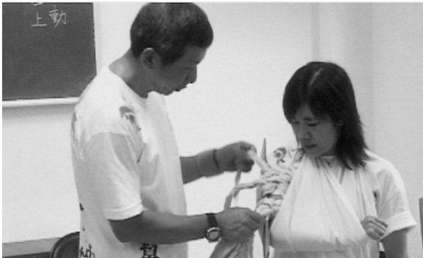
分秒必爭，防止傷勢惡化。