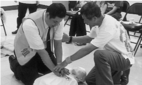
「CPR」心肺復甦術之操練。

吸收學習「CPR」心肺復甦術，以及呼吸道異物哽塞的急救，受傷骨折緊急包紮，希望能在醫師未能到達時或送醫前，給予傷患之臨時救護措施，最主要的目的在於