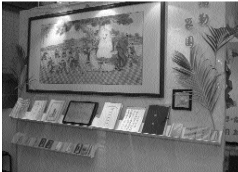
竹南分部呈現圓滿的「彌勒家園」。

清新自然的學界！這群充滿年輕氣息的初生之犢，是道場未來的希望，看到綠領白衣「忠恕學界」的標誌，就想到了他們！八十一年學界啟信班成立，於台北後車站天定堂上課，內容、形式活潑多元，目的是引領年輕學子走近道場，有系統的道場