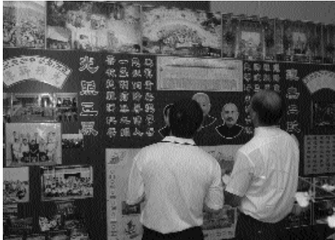
佈置傳統而繽紛的光輝分部。

「我們的學院就像大海，取之不盡，用之不竭，像慈祥的母親推動搖籃的手，也推動整個世界！一熱情地向您招手：著名的愛河、斜張橋、澄清湖景致襯托港都風光，這一南台灣道場尖兵，組織體系相當完整，展現團