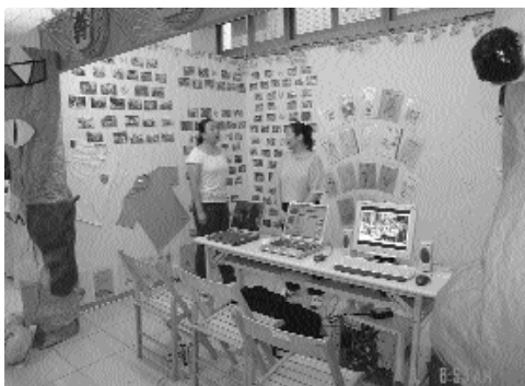
充滿懷舊氣氛的幹訓班！

紙雕塑「幹訓班」營門佈置、製作精緻的假營火，陳列數百張從民國七十六年到九十年的活動照片，歷屆冬夏令營活動手冊如今斑駁而珍貴，張貼著康輔進修會、幹訓班冬夏季營隊制服，走進這裡有如時光倒流，青青子衿、熱血服務、歡樂時光，全化