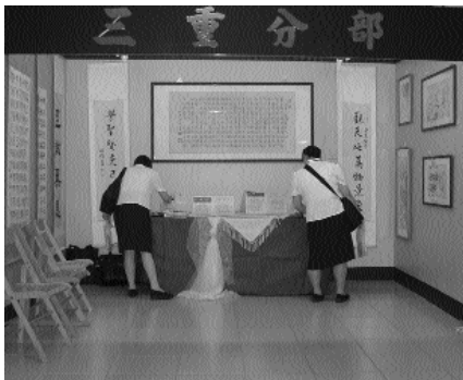
古典藝術氣息的三重分部。

給人不同的視覺饗宴，在展示燈照射下，學員的書法墨寶、山水畫、手工藝作品一一展現，水平頗高。整體佈置古色古香，古典與現代化在空間中交錯，呈現濃厚藝術氣息，現場並有「天恆通訊」期刊、學員學習心得展示，另有上課及道務概況影片播放。