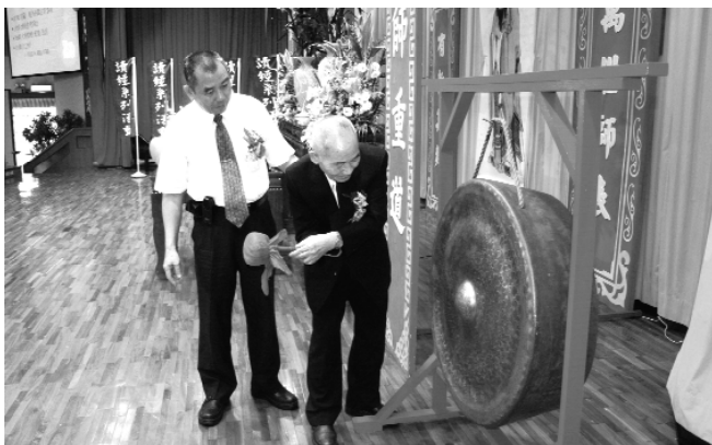
袁前人開鑼，敲開了讀經會考的序幕。