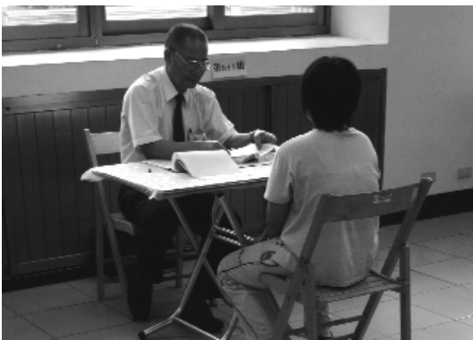
事前充分準備，過關沒問題。