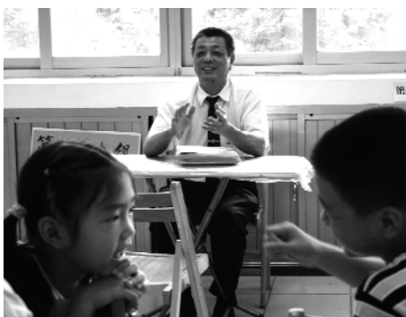
會考前先輕鬆一下。