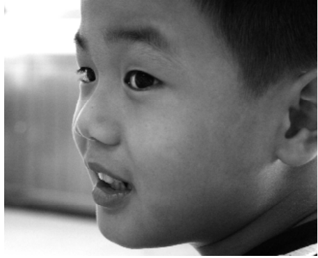
小朋友胸有成竹，滿懷信心。

歷史檢驗和選擇的結果；也是歷史大浪「淘沙存金」的成果，其過程是去偽存真、去粗取精，要費工夫，要付愛心。前人費了大工夫的成本，後人不知利用，那就浪費了，是不繼承祖業。