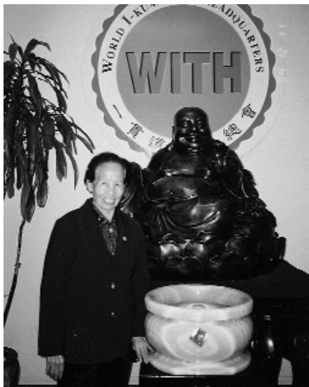
詹點傳師於美國全真道院。

去柬埔寨的飛機航程要三小時，以前都要從越南轉機，現在則有長榮航空直飛，方便許多。一開始尋找有緣道親，遇到寶光道場的前賢開辦道