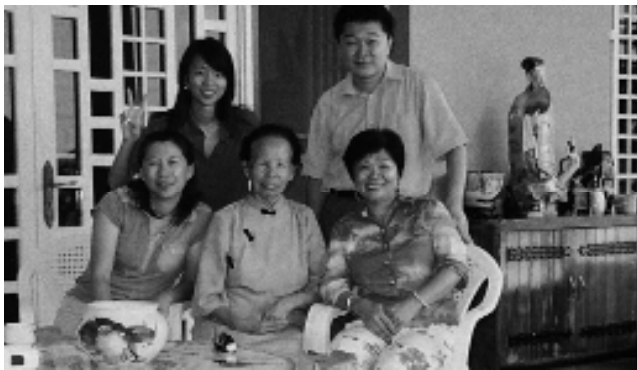
詹點傳師（中）於智利訪道。

訪者，從不言自己『老』，我們在老前人身邊學習太多，感恩都來不及，一定要把身體照顧好，堅強下去，追隨老前人的精神，更要繼續向前衝，身為出國開荒的一份子，更應該加倍感恩老前人