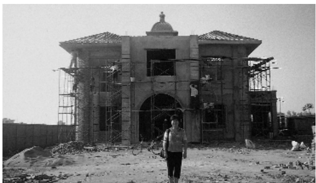
游壇主在柬國設喇堂預定地。