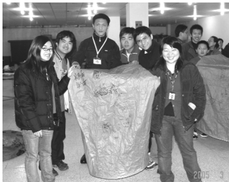
瞧！我們彩繪的天燈不賴吧！

瑩的小水珠閃動在晨光輕輕的搖籃裡；在這幸福的早晨，大夥兒並沒有貪睡不起，而是展開瘋狂的「點心」單元。