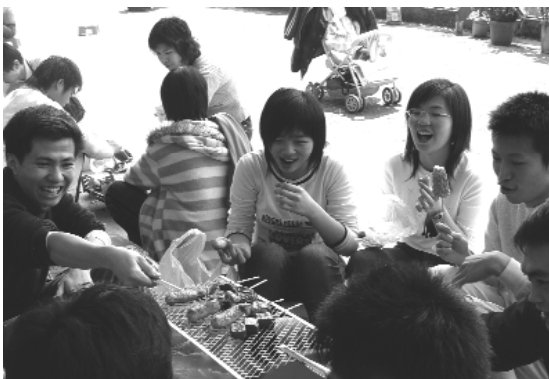
野炊中歡笑聲不斷。

感謝天恩師德、老喇慈悲，前人、點傳師的慈心造就，工作人員投入無比的愛心和關懷，以及無數的心力與時間，讓基隆區域青年道親聯誼活動能夠圓滿成功，相信這最豐富的收穫，會永遠在各位學長心裡留下一個難忘、美好的回憶！