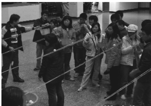
趣味遊戲，看誰功夫了得。

大夥兒的心被這份前所未有的歡愉喜悅，牢牢地凝聚在一起；最後的心靈交流時間，彼此訴說著這二天一夜來，心中所有的感動，這感覺就像靈光交會的雷電，擦亮心靈的眼睛，讓我們瞥見真實的悸動，這份深情，就像寬容柔軟的心，讓人不知不覺沉醉其中。