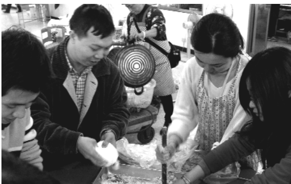
點心製作難不倒我們。

各色天燈施放到天際，當大家抬頭欣望飄向天際的天燈時，我們彷彿同體同命，一同望向這蘊含著豐富的內涵、非凡偉大的世界。