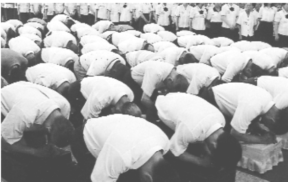
叩求法會圓滿成功。

揚，真是滿心法喜，法會到 此圓滿結束。畢班時，於 老喇堂，分乾坤跪拜叩首謝 恩，下午五點十分在道院前 全體合照，以資永久留念， 參加法會之壇主、辦事員 們，各個法喜充滿的踏上歸 途。