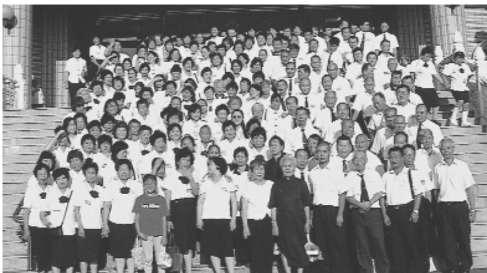
全體壇主，辦事員於法會後合影。