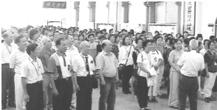
歡迎至善單位點傳師、道親蒞臨光輝道院。

鏡悲白髮，朝如青絲暮成 雪，莫等閒，白了少年頭， 空悲切……同修們能趁年少 好好走修辦道這條路。—— 精進、創新，值得讚