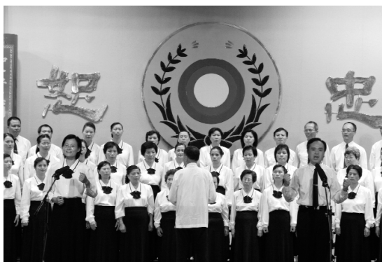
桃園區合唱團精彩的演出。

慶祝大會至此圓滿結束，感謝幕前幕後服務學長辛勤付出，讓活動順利成功，祝福閭家同修、聖凡如意。