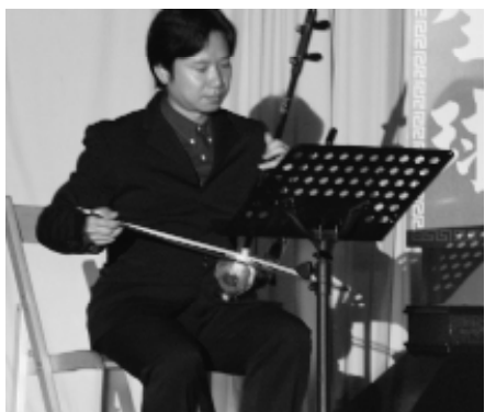
二胡老師獨奏「屏山書信」。