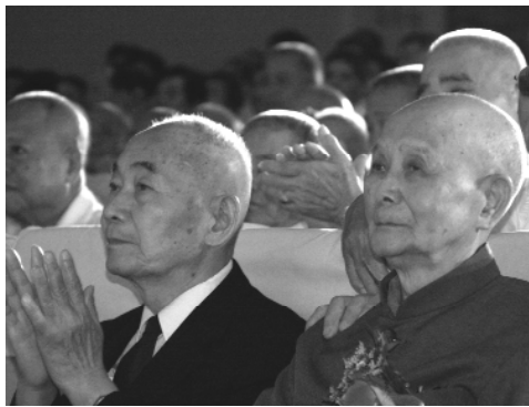
老前人、袁前人德光普照。

日，這一天，忠恕道院展露了最耀眼的慈光，這一天，海內外基礎忠恕人有了最溫馨的家！