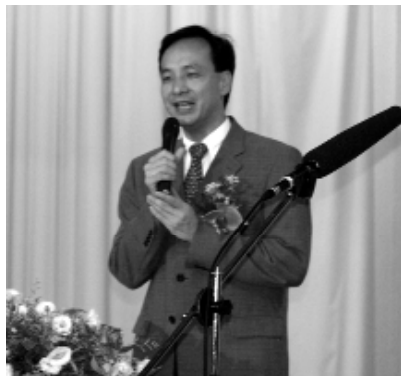
桃園縣朱縣長蒞臨致賀。