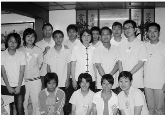
優秀團隊——學界為主的讀經老師。

因為讀容易忘，背才能長久，開發孩子記憶力，要不斷地重複讀，就能記憶，家長陪讀成效更大。未來對孩子升上國高中，國文程度受益良多，孩子對老師也都