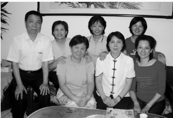
林壇主（左）與講師、愛心媽媽。

教讀經可以培養自己的膽量和台風，以前也是被前賢帶動，現在要回饋道場、尊前提後，更覺得這是一種責任，道場教化是大家的