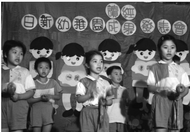
天惠堂日新幼稚園讀經成果表演。

時，就用懂得的國字要求自己每天寫日記，家長很高興。參加讀經班以後，感覺像同學一樣，母子倆都很快樂，聊的都是古人學習的態度、做人的道理。現代人若能將古人的道理應用在現在社會，問題會減少很多，真的是很需要，希望大家都一起來讀經。」（全文完）