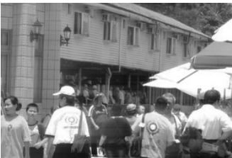
河灣渡假村選購名產。