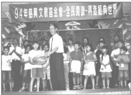
何校長頒發優良親子獎。

慈興文教基金會響應教育部推動「終身學習」，特別舉辦「全民閱讀——再造經典世界」，由三月至十