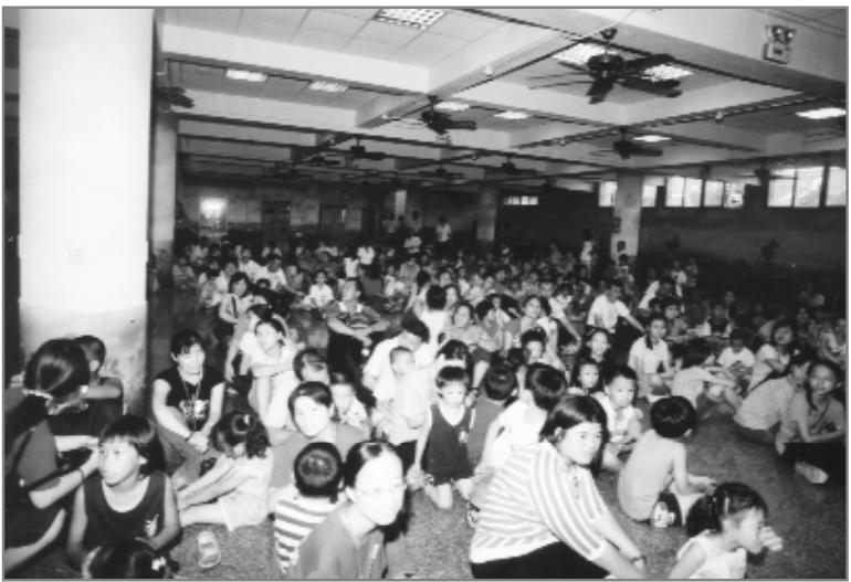
親子閱讀闖關遊戲，記得先排好隊哦！

更感人的是「長青部」的學員有的已經九十歲了，依然能活到老、學到老，為「全民閱讀——再造經典世界」樹立良好的典範。