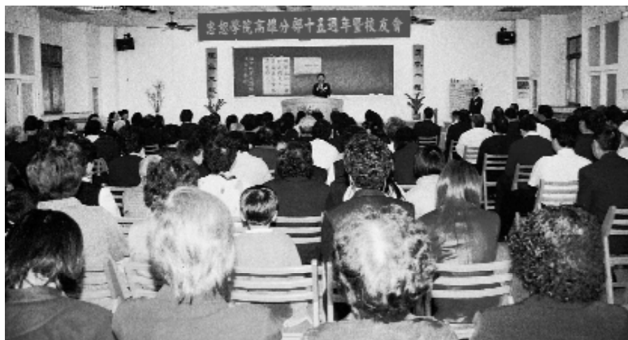
兩百多位前後期同學齊聚一堂。

見過面，當初的年輕人現在也都家業有成，初見面的場面有點像「認親大會」。總操持學長為與會學員，講解了校友會的目的、明德道院的環境簡介以及分部的課程班次介紹。緊接著就是頗有寓意的活動時間，「傳聲筒」讓