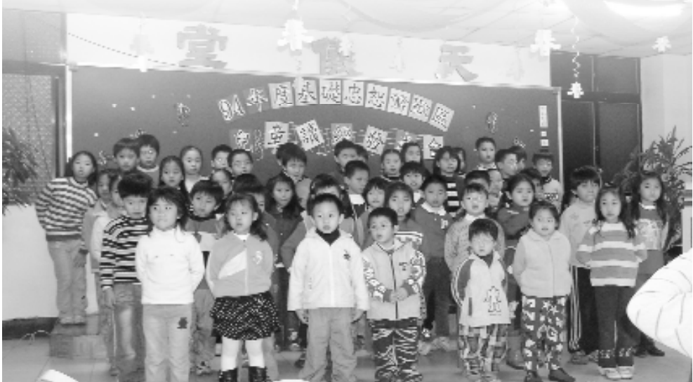
經典背誦輕而易舉！

現今的鶯歌讀經班，各班學童已逾三十人，總人數將近一百名。獲得社會大眾的普遍認同與肯定之後，將來期望積極引渡有緣人來求道，加入一貫道這個溫馨的大家庭，共同為淨化人心而努力。