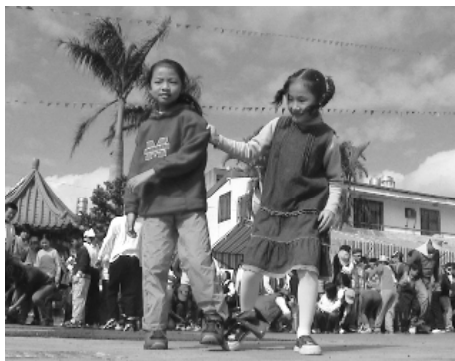
兩人三腳考驗默契。