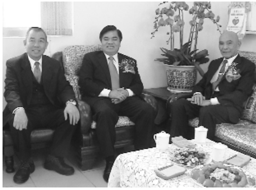
中壢市長(中)蒞臨天德堂。

跟前一天陰雨綿綿的天氣真是天壤之別，感謝上天慈悲，讓天氣轉晴，慶祝活動得以順利圓滿舉行。