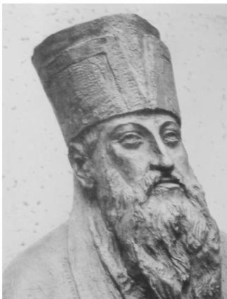
中國歷史上聞名的利瑪竇。

聽開始，然後聲音的多元。人籟的符號是笛子，聲音是從很多人的聲音迴響起，這就是人籟，就從這個多元提供新的脈絡，人籟雜誌的前身是利氏學舍（利瑪竇），也是漢學研究所，在台灣有40年歷史，在大陸先建構成