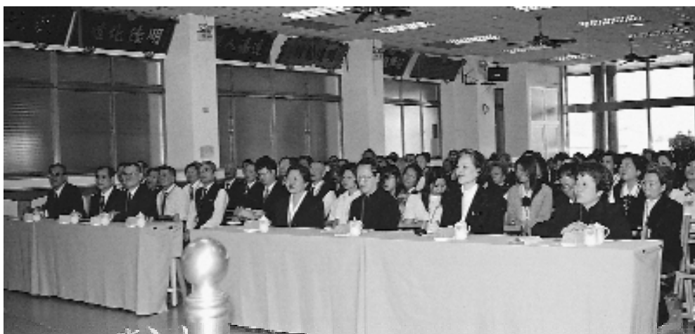
天如單位點傳師、壇主、辦事員齊聚一堂。

「講經說法」是最簡單的說法來講解一句經典的意思，再由點傳師補充說明，無形中也是在考驗壇主、辦事員對於經典是否有正確的見解。「壇務問題」則由各區的道主發表自己在道務上遇到的困難，或好的經驗，