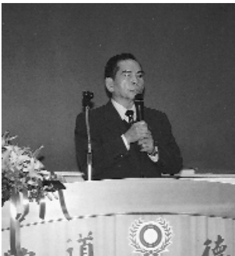
林壇主現身說法證三真。

與所有道親們一起分享。「問題討論」的部份則深入到修道家庭所能遇到的事情，讓一些有實例經驗的道親能發表，讓每個人都能吸收到實質又寶貴的生活之道。更讓點傳師們了解到壇主、辦事員的道務問題並能加以協