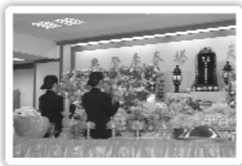
莊嚴隆重的獻供禮

懷先賢之德澤，宏揚孝道，每年舉辦春秋二祭，借此讓道親們撥冗蒞臨參與，以對先賢、祖先們之追思報恩。