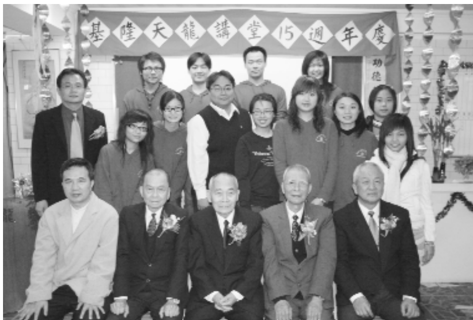
前人、點傳師與天龍講堂幹部合影。

感恩上天的慈悲庇護，天龍講堂所屬的道親，各人皆盡一己之力以回報天恩師德的眷顧。目前天龍講堂的