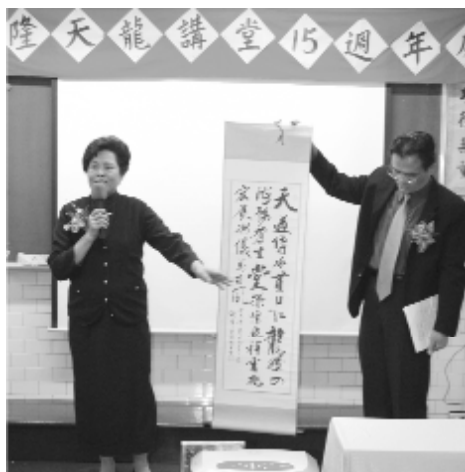
恭賀十五週年慶墨寶。

長所言：「天龍講堂沒有金碧輝煌的外表，但我們有平實的講堂，供我們說仁義講道德；也有樸實莊嚴的廟堂，讓我們皈依禮敬，這就是我們的道風。就像老前人、各位前人及點傳師輩教導我們，修道在於內心的真心實修，而非外在的表現。」