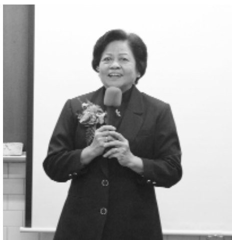
蘇阿足點傳師慈悲賜導。

一、身為一貫弟子，對大道要有充分的了解。如活佛師尊慈語：「不明理，焉修道。」我們來 中堂參班，就是為了明白「生從何來，死從何去」的道理。明白生死的道理以後，才會有充分的信心，進而生出誠心，才能成己成人，達到歸根認 中的終極目標。