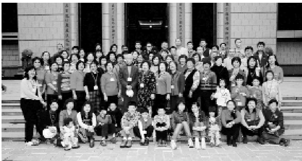
點傳師與道親們在中台禪寺合影。

在出遊當日的早獻香，照例點傳師指示各ㄟ堂叩求 老ㄟ慈悲保佑活動平安順利。當日天氣出發前陰雨不斷且有點濕冷，但道親們均有信心的說，現在下雨，等下車遊覽時必天空放晴，天氣怡人。真如大家的期待，到達目的地真不下雨了，且是一天的好氣候。這就應了「三分誠心，七分感應」。點傳師在賜導時也說一切的恩典全仗 老ㄟ的慈悲，讓一天的行程平安順利。在此也特別感謝學長們的慈悲，讓春之頌知性學習之旅圓滿達成。