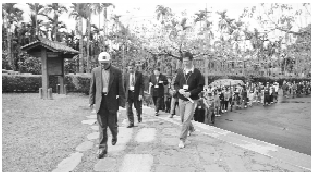
點傳師率領道親們參觀清幽的德山寺。

因時近中午，所以在結束文武廟及日月潭景色瀏覽，便直奔用餐地點 - 中台禪寺旁一間新開張且以素食為主題的典雅精緻的飯店「平雲山都」。不但全素食且禁菸。八菜一湯物美價廉，道親們均十分滿意。也感受到現在修道人真是幸福，也更該惜福。用餐畢，車輛直上中台停車場。點傳師