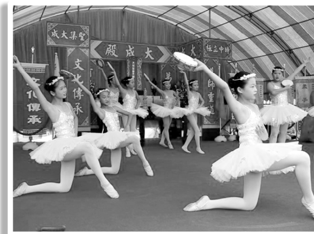
精彩的芭蕾舞表演。

這次的「竹南鎮民讀經大會考」能夠圓滿達成任務，我們要感謝天恩師德、張老前人大德、及各位點傳師的慈悲與天仁所屬各地方學長的贊助動員，可以說是一貫道道親們的一次大團結，也是大凝聚，將彼此修道的心契合的更緊密、更有信心，也讓一貫道的聲譽更向前跨出了一大步，更能讓社會各界肯定與認同。