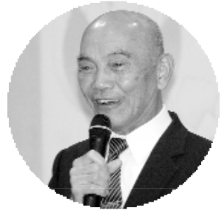
總會副理事長簡前人致詞。

大會並安排徐常務理事講述專題「道的尊貴 談開荒」。以自身體悟談到：凡我修道人應真心修道，所謂人大有願，天必從之。回想前人輩們開荒辦道的精神，那種犧牲奉獻，一切為眾生出離生死，悲天憫人的菩薩行誼，著實讓身為後學的我們，在修道的人生當中，引以為榜樣。但如今在此時代，渡人求道非常不易，更不用說是參班聽道理了。若是在四、