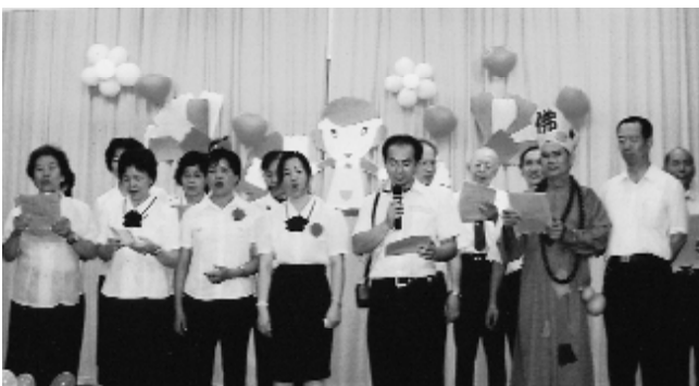
餘興節目「道歌教唱」。