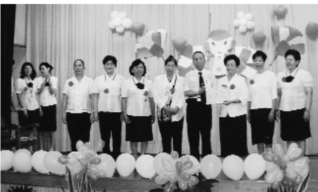
表揚、頒獎模範母親。