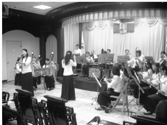
▲ 寶光聖堂國樂演奏。

一貫道寶光玉山寶光聖堂，位於台南縣南化鄉玉井村，距離南化水庫約三公里遠，1997年獲選為「南瀛八景十勝」之一，由縣政府與觀光協會立碑紀念。氣勢震撼、聖堂巍峨、莊嚴典雅，有三十餘年歷史，由王壽老前人創辦，是道親們流血汗、一步一腳印、精神奉獻的偉大結晶，雄偉的整片山坡上，矗立著幾處古典瑰麗大