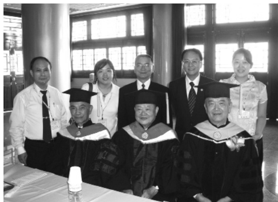
▲ 前排左起：簡前人、王前人、蕭點傳師受獎。

info@greenmotion.org) 共同為解救地球、人類萬物福祉盡一分心。