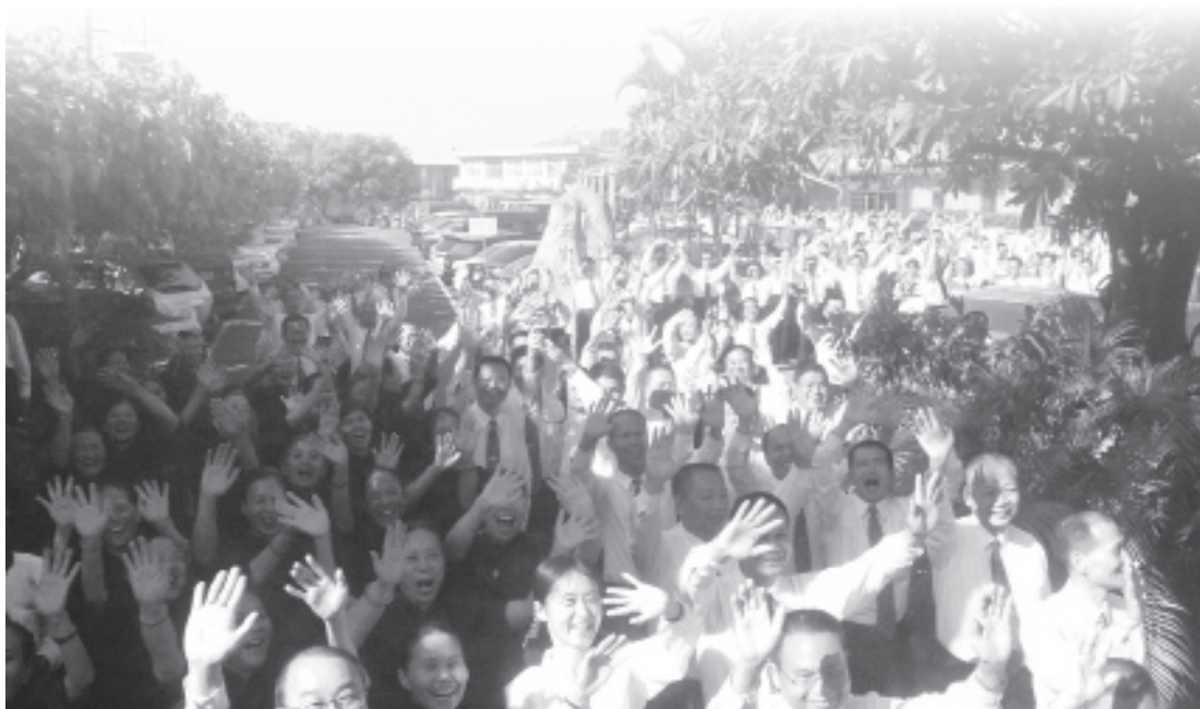
▲ 崇正寶宮前賢熱烈歡送。

同，教化儀規方式互異，但是引導人心人性走向真善美的境地，是各教共同的崇高理想與實踐，沒有語言、國界、種族的障礙，真理與善心是一樣的；畢竟各教同源，但願殊途同歸。感謝各宗教代表參與這次的聯誼活動，讓我們共同開啟了另一個好緣，道別後，回到各自工作崗位，一起為教化人心繼續努力。感動於美國韓格爾校長以一位長者身分，慈祥和藹熱情的與大眾互動，並真心對待每一個人，呈現宗教人的慈懷和包容，熱情地與我們擁抱和道別，也記取總會蕭副秘書長說的：希望大家懷抱著彌勒佛的笑臉，常常帶給眾生歡喜心，期待明年度「宗教聯誼」再見！