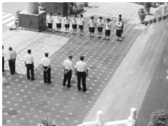
▲ 純陽聖道院前賢列隊歡迎。

德理事長更親自迎接，巍峨的宮殿式建築在陽光下閃亮耀眼，剛辦完重建落成10週年慶。導覽介紹了：文物館、莊嚴中堂，典藏、古籍、佛龕、前輩行誼、傳道歷程、影片簡介，其宗旨為：建構本世紀最優質的道場。