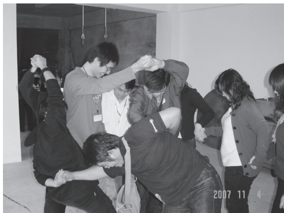
▲ 數字遊戲卯勁以赴。

行程。平常生活在都市裡，睡覺時間都不夠了，更別提撥空踏青做運動，但也因為這樣，導致身體這裡酸那裡痛的，做完瑜珈後，發現身體輕鬆好多，而且更有活力。因為一小時的瑜珈課程，啟發了我現在每週學瑜珈的興趣。