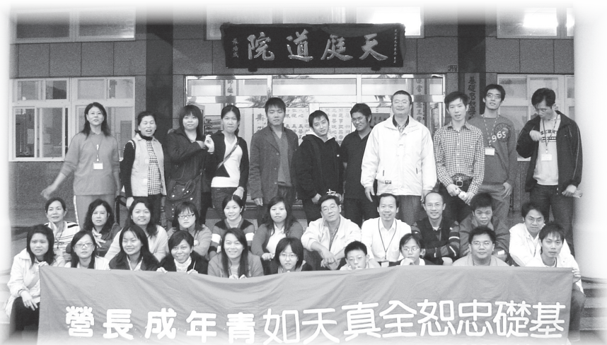
▲ 成長營在美麗的天庭道院舉行。

原本計畫在八月九日舉辦的活動，遇到二次颱風登陸而一延再延，到十一月三日舉辦。臨行前，宜蘭前賢告知已連續下了近十天的雨，有幾天還是滂沱大雨，提醒我們要有心理準備及替代方案。但活動期間僅偶下細雨而已，這是上天最好的安排，再次感恩上天的慈悲。