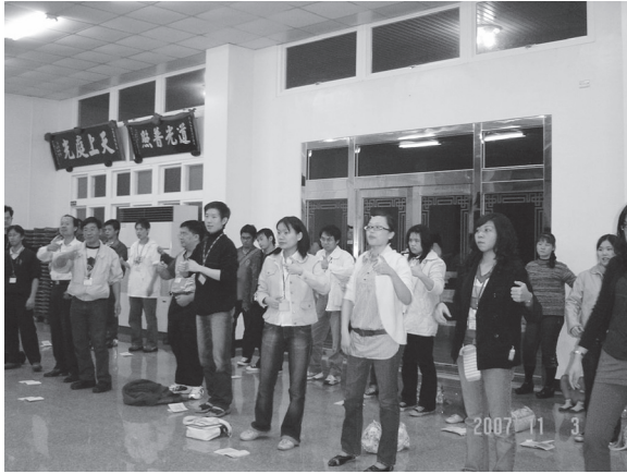
▲手語帶動唱拉近彼此的心。

二次青年成長營的活動，這次活動內容和上次一樣的豐富，第一天在到國立傳統藝術中心見識到了多達600多件的紙雕藝術，真是讓人嘆為觀「紙」啊！民藝街坊裡的30餘間傳統民藝店舖，讓人彷彿走進了時光隧道的歷史城鎮。還觀賞了一場「鯽子魚娶某」，看著逗趣的動物及昆蟲們大跳迎娶舞蹈，讓活動加上了喜氣。下午的瑜珈真的是不錯的安排，雖然只有30分鐘的課程，但卻足以讓全身筋骨都舒張開來，美中不足的就是教室太小了。晚上來到天庭道院，餐後活動組安排了雙人舞，難度有點高了些，怎跳都跳不好好氣餒。晚上促進認識對方的心臟病遊戲，沒心臟病真的會被逼出心臟病……（呵～開玩笑的）。