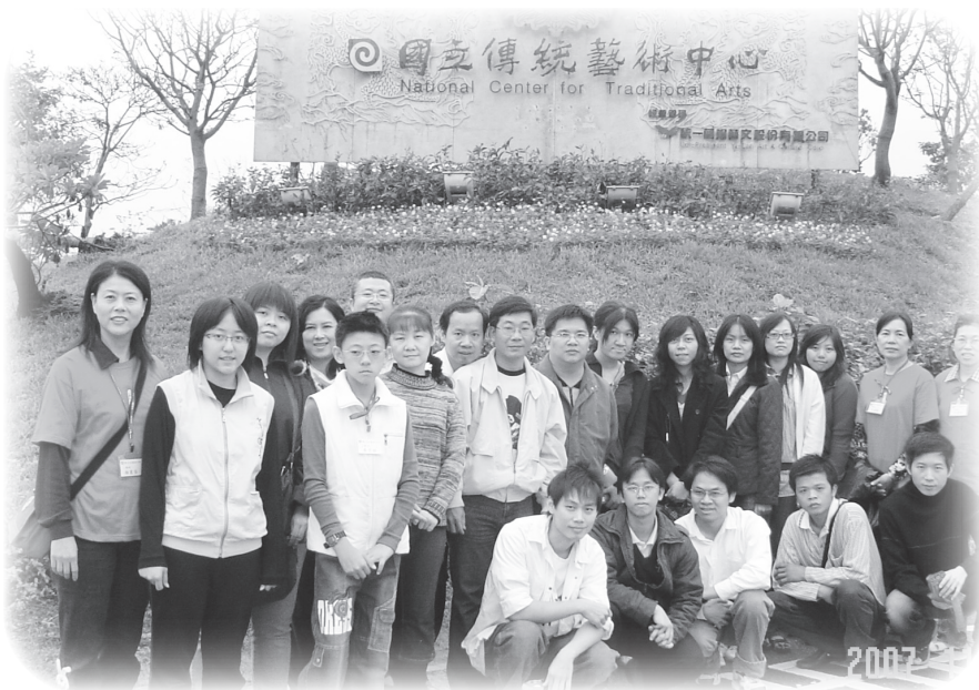
▲ 在宜蘭傳藝中心合照。