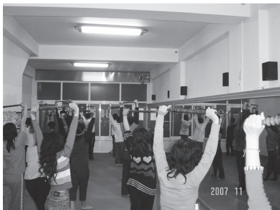
▲ 瑜珈時間，放鬆筋骨精神好。

晚餐過後討論問題，才了解男生女生的觀點，原來環境立場角度的不同，看法也就不同，最後的選擇與抉擇自然大不同，接著所安排的動感時課，帶動韻律舞蹈，為了就是拉近彼