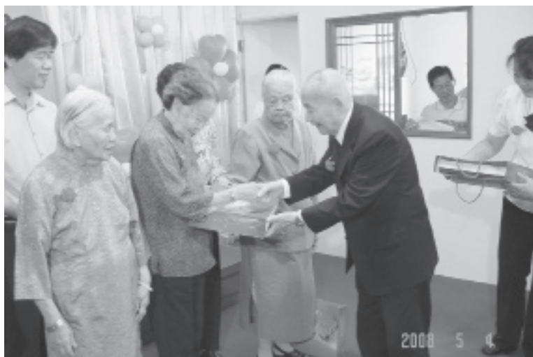
▲ 袁前人頒發賀禮予90歲以上的道親媽媽。

候就開始讀些入門的基本須知，《孝經》也是其中之一，而成人的班次也會讀《孝經》，講《孝經》。《孝經》開宗明義：「孝，德之本也，教之所由生也。」又說：「身體髮膚，受之父母，不敢毀傷，孝之始也。立身行道，揚名於後世，以顯父母，孝之終也。」