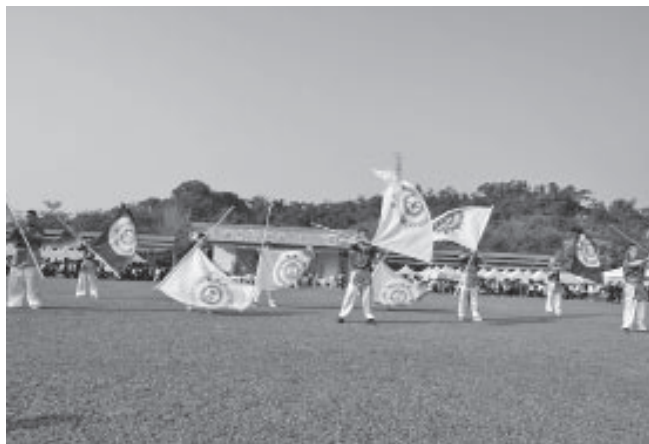
▲ 雄壯威武的旗隊表演。