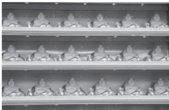
▲ 億萬尊彌勒祖師護持道場。

占地廣達三百多公頃，建築物沿丘陵地勢座擁而下，具四平八穩、萬德莊嚴之相，為神威天臺山之主要骨幹，整體構思為新古典宮殿風格建造，內部有鋼骨結構支撐，厚實混凝土並用以粗大綱筋建築而成，四面環繞粗獷石柱，屋頂為古典式鍍金琉璃瓦結構，外觀為花崗岩大理石壁，並譜以金黃與靄白兩色互相搭配，是一座兼具古典藝術價值與現代化建築風