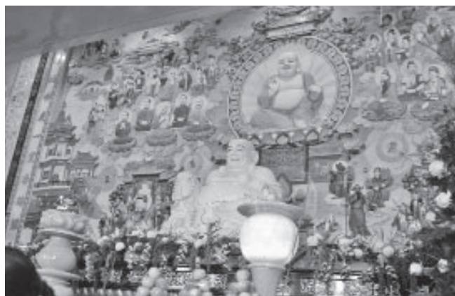
▲ 彌勒祖師掌理收圓大事。

占地廣達三百多公頃，建築物沿丘陵地勢座擁而下，具四平八穩、萬德莊嚴之相，為神威天臺山之主要骨幹，整體構思為新古典宮殿風格建造，內部有鋼骨結構支撐，厚實混凝土並用以粗大綱筋建築而成，四面環繞粗獷石柱，屋頂為古典式鍍金琉璃瓦結構，外觀為花崗岩大理石壁，並譜以金黃與靄白兩色互相搭配，是一座兼具古典藝術價值與現代化建築風