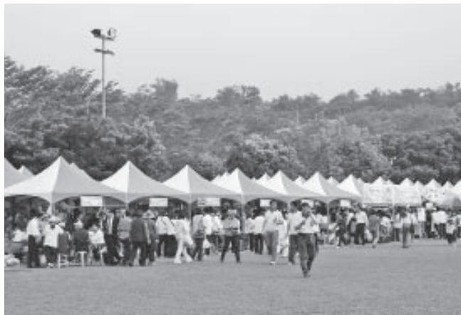
▲ 熱鬧溫馨的園遊會場。

紀念郵票、電話卡、白陽三聖公仔，寫許愿卡向老中及仙佛祈愿，園遊會場四週上百個各式攤位生氣盎然，多元化慶祝活動同步展開，隨處可見不同膚色、種族、語言的道親，一個點頭、一分微笑，不分您我，同為一中之子，一師之徒，同得天恩護庇，同受師德加被，沐浴在祖師的慈懷。