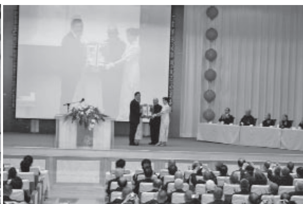
▲ 林前人回贈彌勒祖師像與總統紀念。