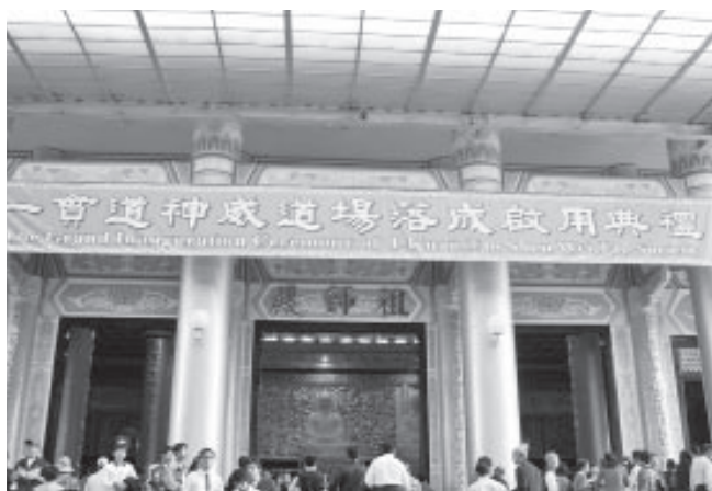
▲ 祖師殿啟扉人潮擁。

六龜「新威」變「神威」有一段新威土地公、土地婆求道的殊勝的因緣。在延綿百年的時空，祂們攜手同駐六龜聖地，前世今生與寶光建德道場的累世善緣，只等待時機成熟一指超渡。