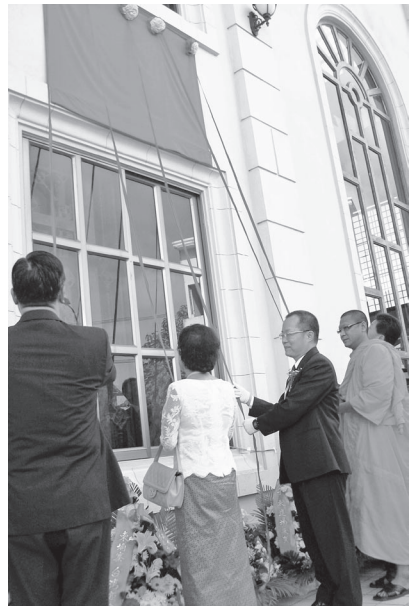
▲ 2009年3月22日成立大會揭幕式。

師、講師及前賢們共同參與盛會，更有柬埔寨台商會江理事長、秘書、幹部等，總計一千多人參與祝賀。