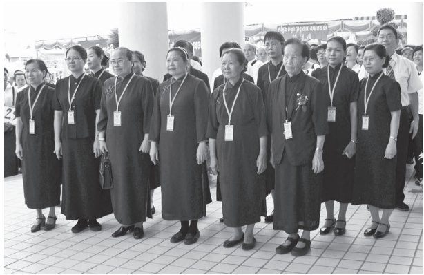
▲ 參與盛會的坤道點傳師與前賢。