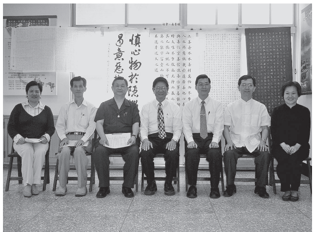
▲ 評審委員與優選作品合影。