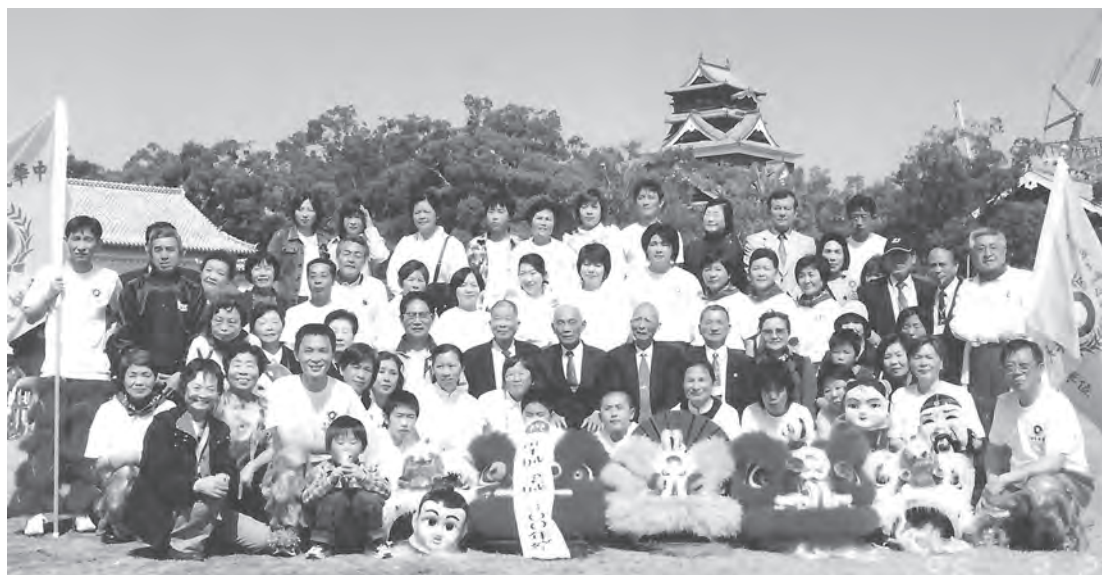
▲ 與簡前人、點傳師及道親們攝於日本九州。

今天是重要且值得歡喜的日子。醫生與家屬期待已久的一天終於來臨：家父排便成形，顏色正常。然而後學發現近幾天來，家父每次用吸管吸水時會噎到而咳嗽。後學心中不解，為什麼吃稀飯時不會發生，經過