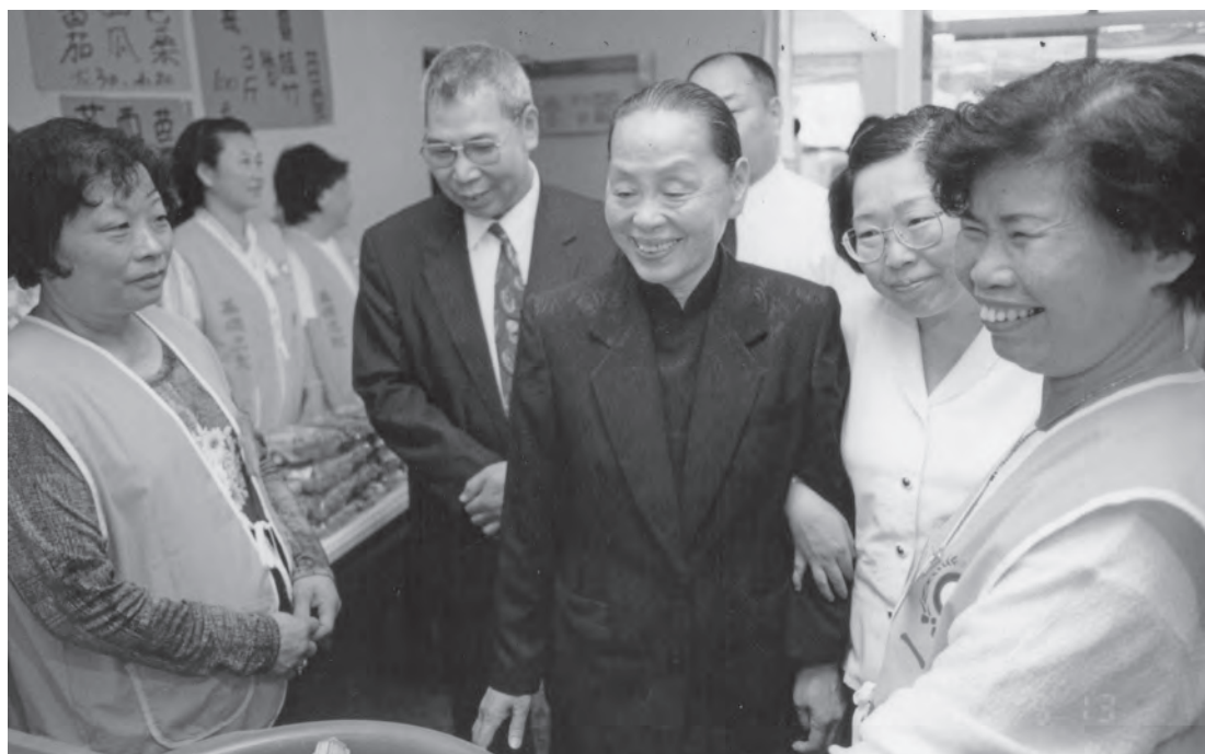
▲ 陳老點傳師殷殷關懷教化。

請辦道，為了不讓道親起疑，就勇敢地穿上旗袍，硬撐著虛弱的身軀去辦道，回來後傷口迸裂，緊急開第二次刀，結果一度「失聲」，完全沒有辦法講話，老點傳師非常緊張！心想若從此無法講話，要怎樣代天宣化，度化眾生呢？還好經過調養，一個月後才逐漸恢復。