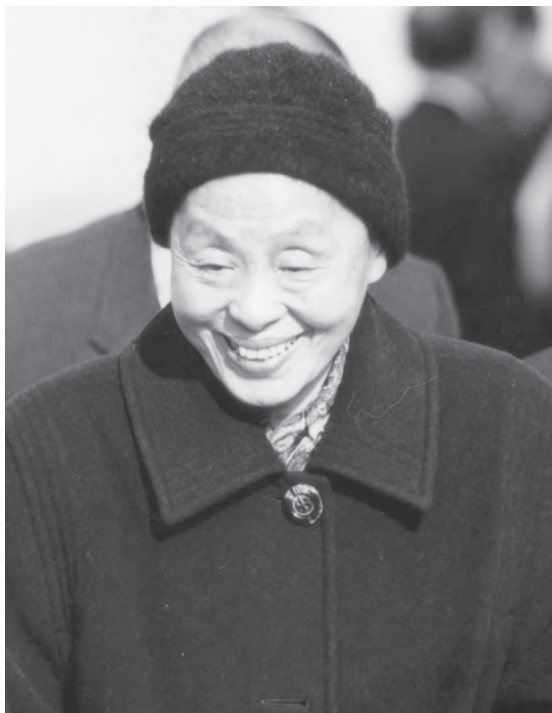
▲如沐春風的陳老點傳師慈顏。

開始道務整合。老點傳師深體道務整合的重要性，遂指示道務整合原則：一要尊師重道；二要團結合作；三要循序漸進；四不可阻礙道務的發展。經過約十年的努力，道務整合終於完成，把國內道務分區為忠、孝、仁、愛、信、義等六大單位，目前有三十多位點傳師，約七百間的家庭中堂，國內有台北天惠堂、天註堂、土城福山天惠堂、中壢廣德堂、新竹錦屏道場、彰化天惠道院、岡山天惠堂等大型公共中堂。