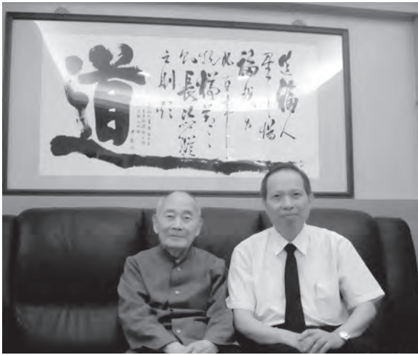
▲ 前人慈悲賜導：「小心，天下通行；大意，寸步難行！」