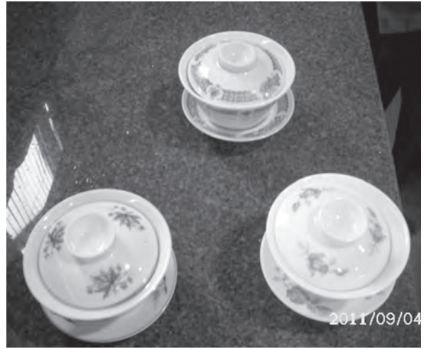
▲ 不同色系之三件杯。