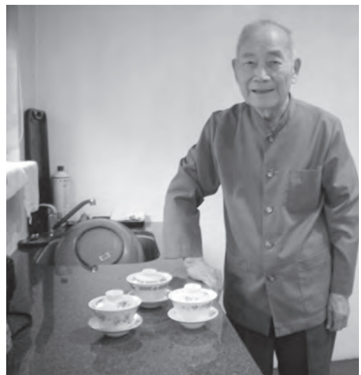
▲ 前人慈悲：「獻供最主要是誠心之表現，而不在外相之色系。」

啟示：獻供茶、敬果和 明明上帝、諸天神聖結緣，以表誠心。同時感恩 明明上帝降道普傳。值此三期，當掃三心、去四相，無為而為，精進不懈。