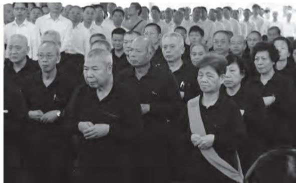
▲ 天惠點傳師進行家奠。

家奠禮於上午7時開始，在獻供、合唱團唱誦彌勒真經後，首先由遺族上香奠拜，分別恭讀追思文，感動涕零。8：20分許，天惠道場道親進行家奠禮。依序由國內點傳師群及忠、