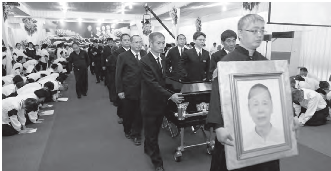
▲ 跪送敬愛的老點傳師：發引。

勢趨緩，陰霾漸散。繼之群山峰頂林梢間，朝霞迸裂，天青雨歇。天際間露出了旭日曙光。當天來自全省北、中、南各地的道親，或凌晨發車，徹夜未眠；或破曉時分，驅車前來。1000多人紛紛於清晨5、6點抵達定點。在交通服務學長的指揮下，不疾不徐，井然有序，分流接駁上山，表現出修道禮儀最佳典範。