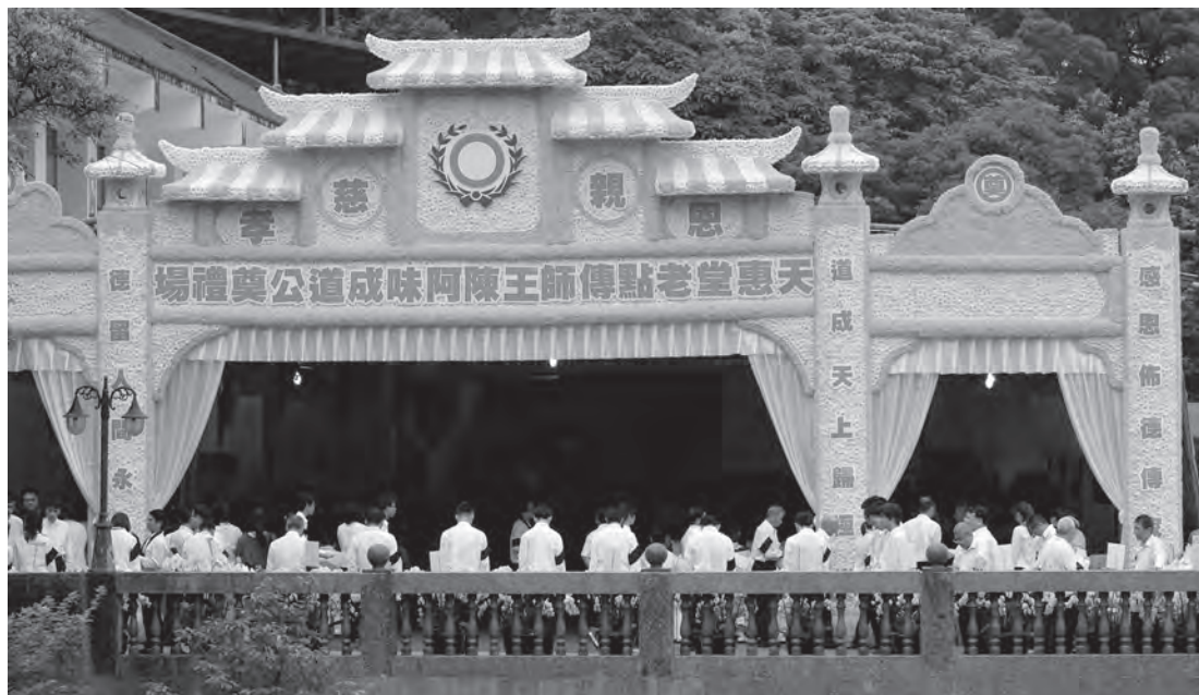
▲ 奠禮式場莊嚴哀戚。

身素雅清新。原本療程中留下的皮膚病變，歸空後竟不藥而癒。不但恢復生前慈祥、莊嚴的神韻，甚且益顯樸實童顏、吉祥尊貴法相，完全不需要再勞煩化妝師。大家在瞻仰遺容時，看到了老點傳師本來的聖容，這是真修實煉、返樸歸真的印證。