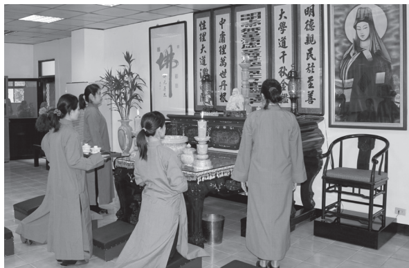
▲ 天青堂——充滿青年學子的感恩回憶。

次培養人才。現在道務有乙批人才，也是當時由各班次班員中所培養出來的菁英；當時道院也成立道德經班8年，家兄請王顯榮點傳師主講。