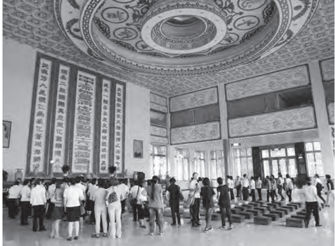
▲ 新道親參觀忠恕道院中堂擺設實景。

朝一日，都能回歸到這清淨無染的天心，才能識本達源、返璞歸真，不負得明師一指殊勝因緣。