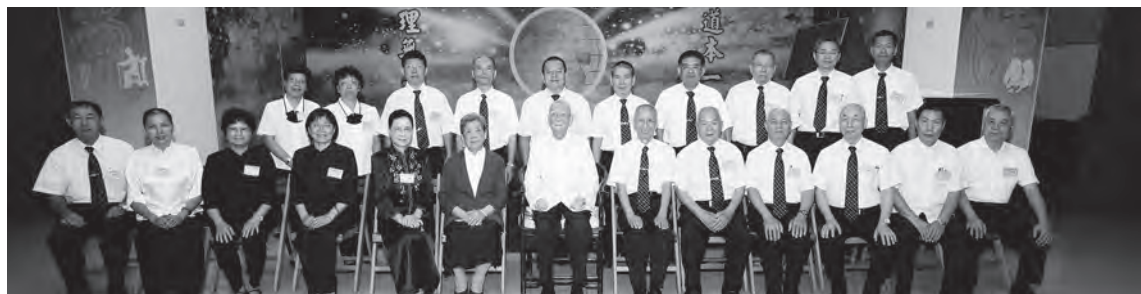
▲與陳前人合影留念。