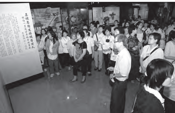
▲ 新道親參觀文物館並仔細聆聽解說。

最後勉勵所有在場的新道親們定要謹記：1. 不離佛堂；2. 不離善知識；3. 不離經典，共創美好人生。