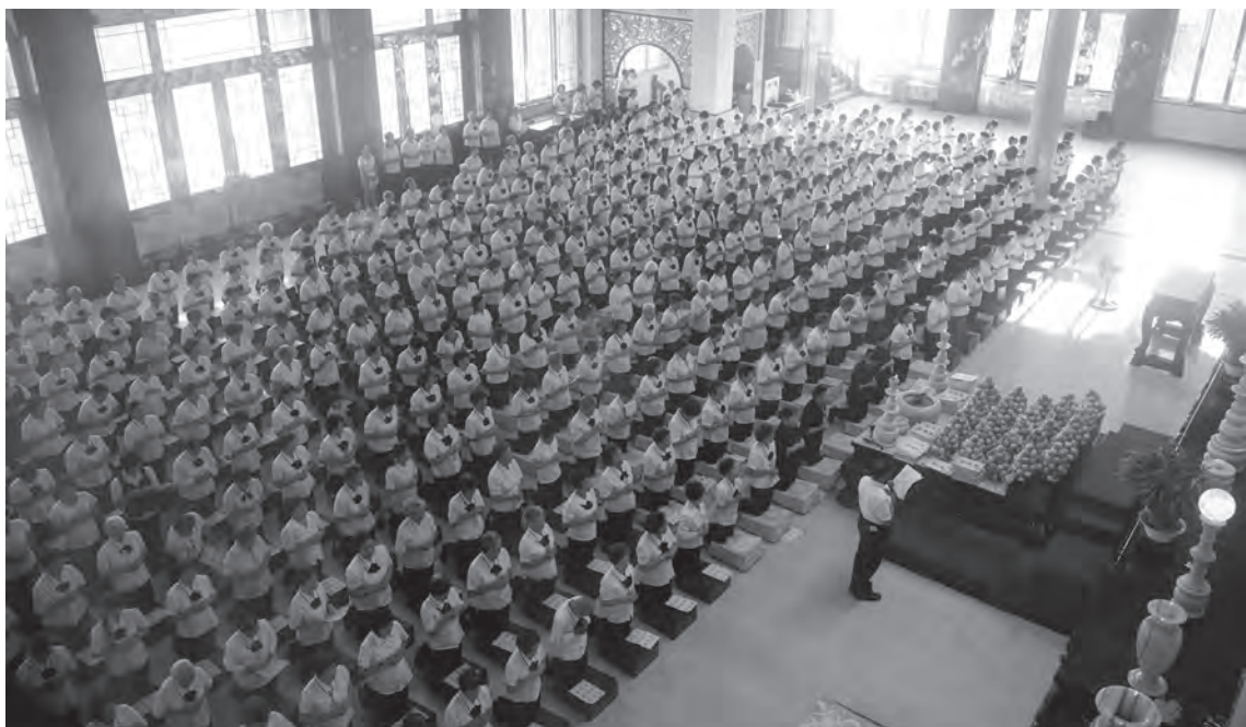
▲ 坤道點傳師及壇辦人員於佛前立愿。

註：西元 2008 年 12 月 27 日，馬來西亞吉隆坡巴生區崇德臨時中堂訓文。