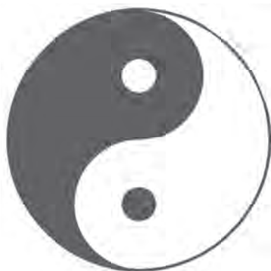
▲ 太極圖陰中有陽，陽中有陰。

所謂太極曲線，在大圓內取兩個內切的小圓一半，這是古代曲線二等分一個圓的最簡易幾何作圖法。此圖