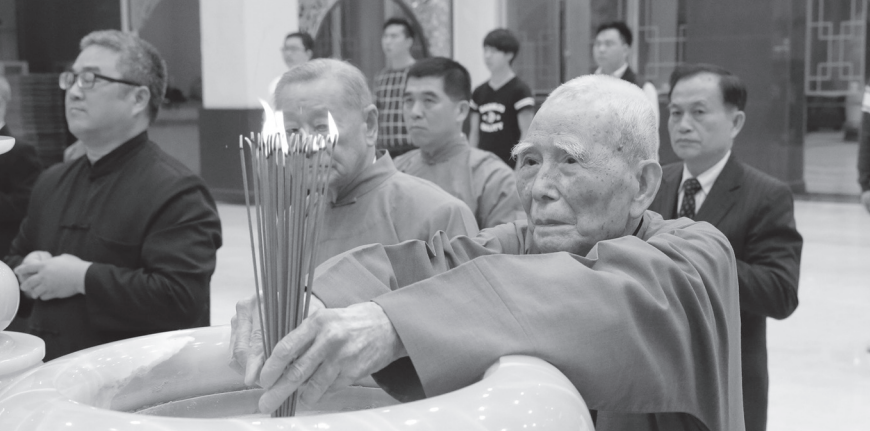
▲ 甲午年除夕忠恕道院拜年禮，陳前人慈悲獻香。